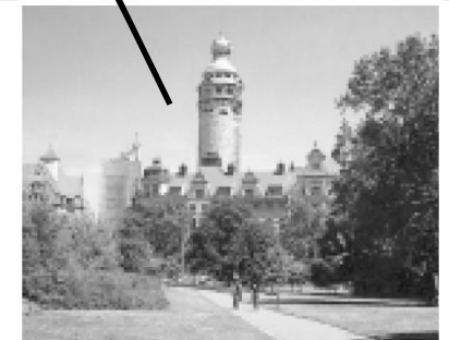
Neues Rathaus der Stadt Leipzig